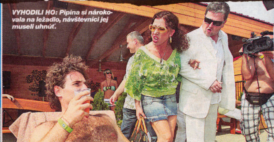
VYHODILI HO: Pipina si nárokovala na ležadlo, návštevníci jej museli uhnúť.