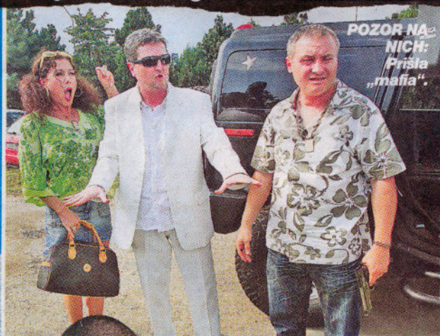
POZOR NA NICH: Prišla „mafia“.