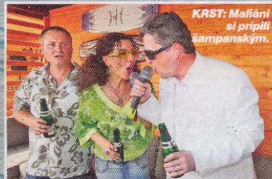
KRST: Mafiáni si pripili šampanským.